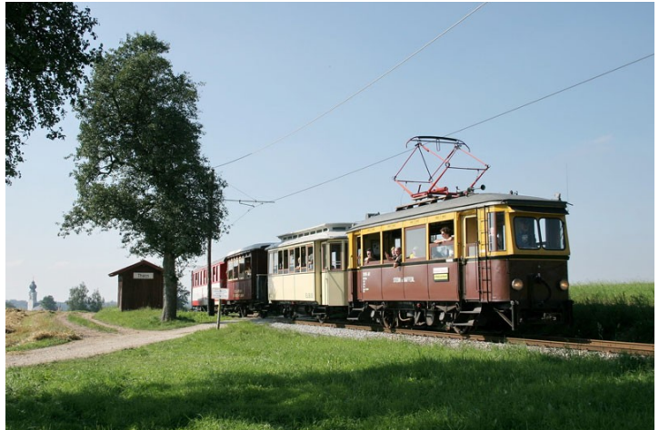
Attergaubahn nostalgietrein in Thorn, 30-8-2005.

's Morgens rijden we met een S-Bahn naar Vöcklamarkt. Daar staat voor ons een historische trein van de Attergaubahn klaar waarmee we, met fotostops onderweg, naar Attersee zullen rijden.