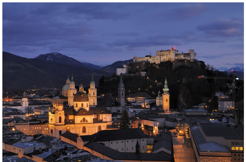
Festung Salzburg.

Op deze dag is het mogelijk om de stad of omgeving te verkennen.