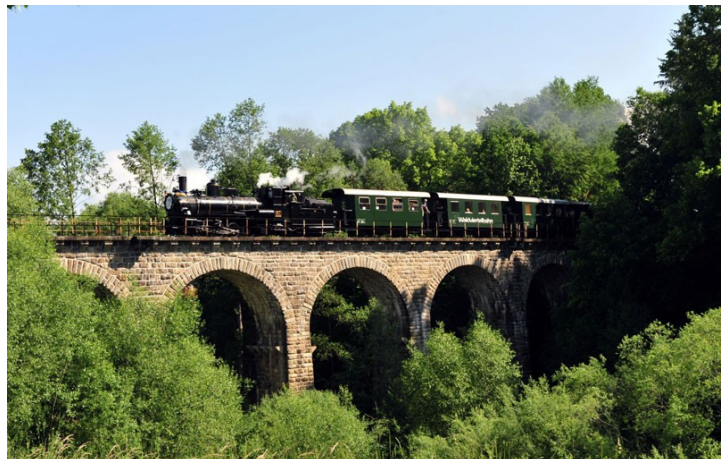
Mh1 + trein bij Weitra, 26-5-2018.

Vanuit České Budějovice gaan we met een regionale trein via České Velenice naar Gmünd in Oostenrijk. Daar wacht een stoomtrein op ons waarmee we de smalspoorlijn naar Gross Gerungs en terug gaan berijden met enkele fotostops onderweg. We krijgen een lunchpakket mee.