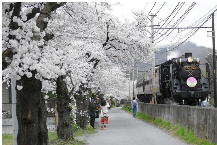
Paleo Express, 5-8-2017.

Het eerste reisdoel is de Paleo-express, een door een stoomlocomotief getrokken luxe trein die ten noordwesten van Tokyo rijdt. De rit begint met de metro om bij het juiste vertrekstation te komen en dan rijden we rechtstreeks door naar het eerste belangrijke station van deze dag, Seibu Chichibu.