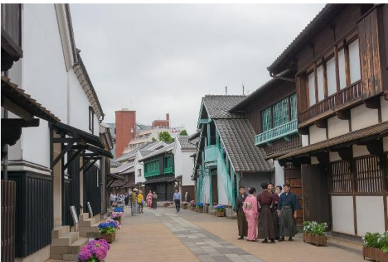
Tram Nagasaki, en Decima.