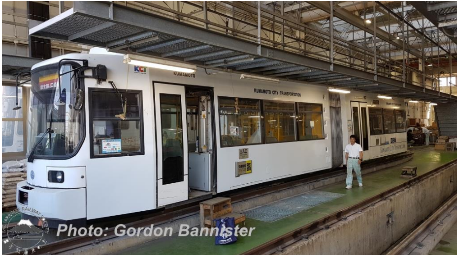
ADtranz GT4N wagen 9705 in de remise. 29-9-2017.

De stad zelf is niet veel anders dan anderen. Er is een groot kasteel van ruim 550 jaar oud maar dat is na een aardbeving in 2016 deels ingestort en de wederopbouw gaat niet echt snel. Maar niet getreurd: Kumamoto is een tramstad!