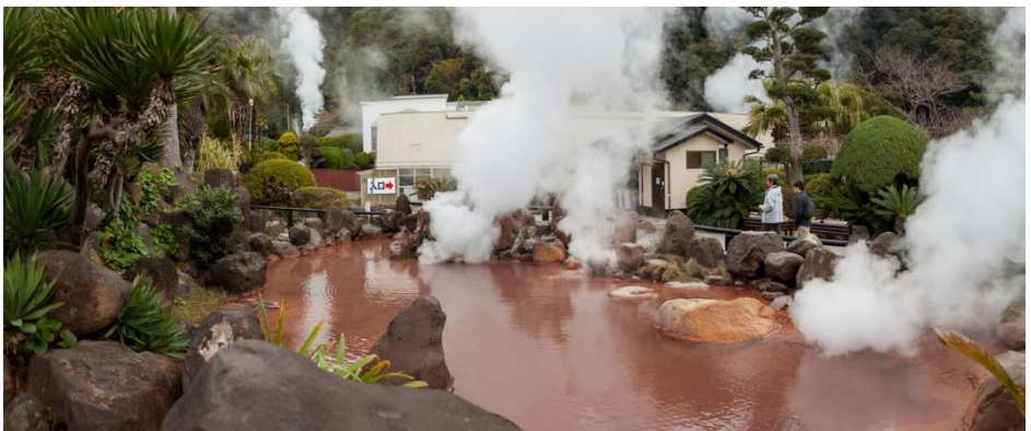
Hell bron in Beppu. 6-1-2026.

De trein rijdt door een gevarieerd landschap van west naar oost en passeert de een-na-grootste, zeer actieve vulkaan Aso. Na de Aso doorkruist de trein een ruig landschap om aan het begin van de middag uiteindelijk via Oita in Beppu uit te komen. Dit is een stad met een grote hoeveelheid warme bronnen en badhuizen. De “Hells of Beppu” zijn bronnen in vele vormen en maten die niet geschikt zijn om in te baden. Dat zal je zelf ook wel concluderen als je ze ziet.