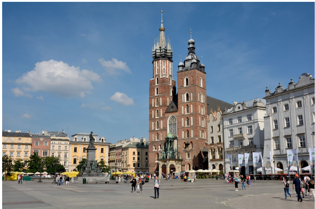
De Mariakerk op de Rynek Główny in Kraków, 8-9-2021.

Op deze dag is er de mogelijkheid om de historische stad Kraków te bezichtigen en ook het tramnet te verkennen.