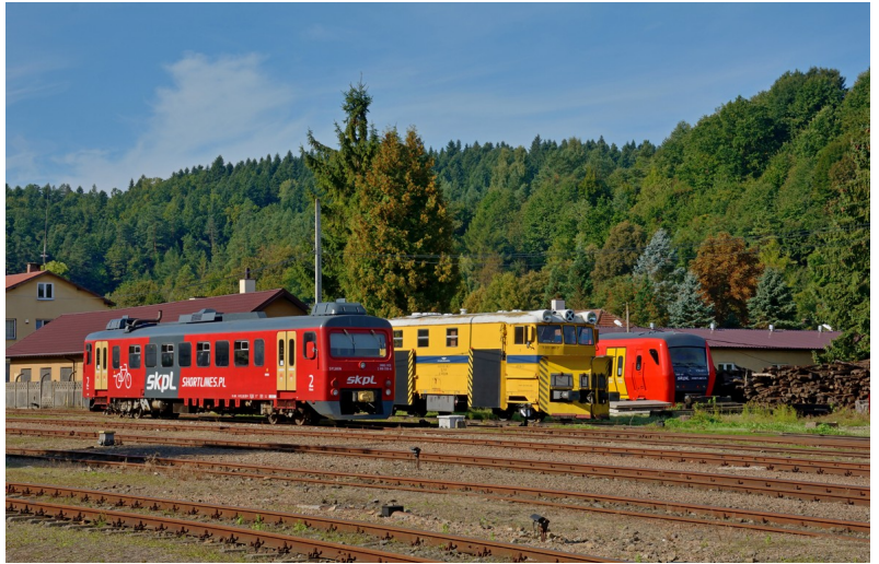
SN82-002 "Sylwia", 411S Nr 121 en SD85-001, Zagórz, 7-9-2021

Vandaag staat er een excursie met een Wadloper op het programma. Omdat het niet mogelijk was een overnachting in de buurt te vinden reizen we vanuit Kraków om 09.00 uur met een Intercity naar Zagórz (waarschijnlijk een ex DB treinstel serie 614), waar de aankomst om 13.09 uur is. Hier staat dan een Wadloper klaar voor een excursie van ongeveer 2 uur naar Komańcza en terug met onderweg enkele fotostops. Om 15.45 uur vertrekken we dan weer met de Intercity naar Kraków waar de aankomst om 20.06 uur is. Deze dag krijgen we een lunchpakket mee.