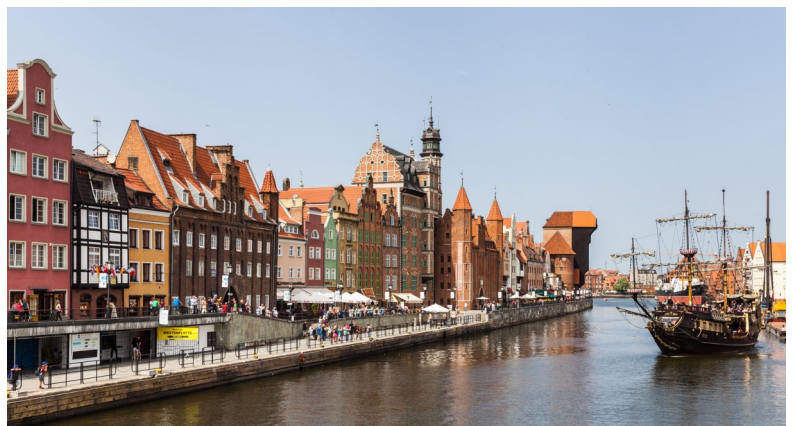
De oude haven van Gdańsk.

Vandaag moeten we vroeg opstaan om naar Gdańsk te reizen. We vertrekken om 07.25 uur uit Gorzów en reizen via Krzyz, Chojnice en Tczew naar Gdańsk Gł waar de aankomst om 13.06 uur is. Er is een grote kans dat de trein van Chojnice naar Tczew een Wadloper is. In Gdańsk krijgen alle deelnemers een 72-uurs kaart voor het regionale openbaar vervoer. We reizen dan met een voorstadstrein naar Gdańsk-Oliwa. We verblijven 3 nachten in het hotel Oliwa park residence op ongeveer 15 minuten lopen van het station. De rest van de dag is vrij.