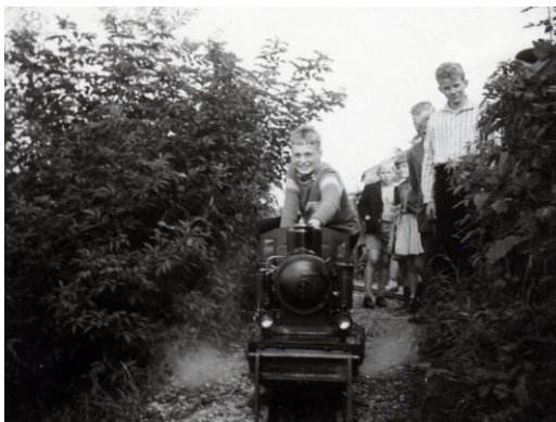
Ton op loc Pluto, Lekdijk, Vreeswijk, 1961