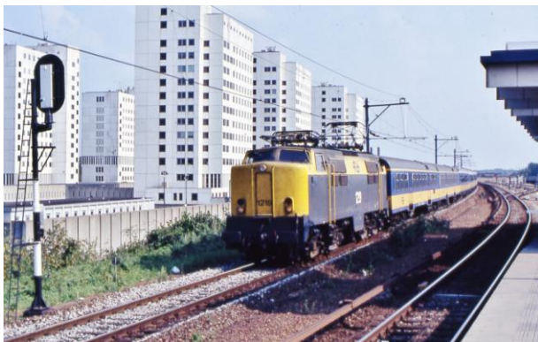
NS Amsterdam Spaklerweg (Bijlmerbajes), 1990

Een erg gevarieerd videoprogramma, dat verschillende groepen railbelangstellenden zal aanspreken, met opnames en presentatie van René Platjouw.