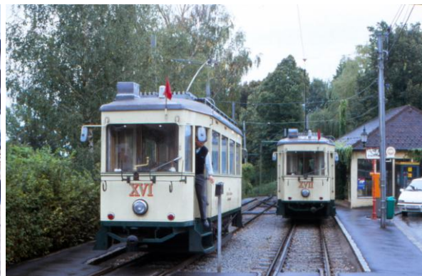
Linz - Pöstlingbergbahn