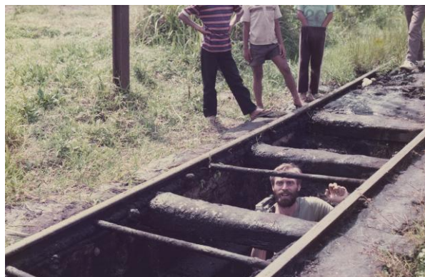
Ton in werkput, Cibatu (Java), 1984.