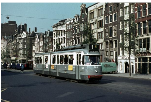
Amsterdam, GVB 565 (1), 26-05-1964