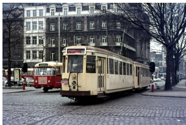
Antwerpen, NMVB 9745+19558 (50), 10-03-1966