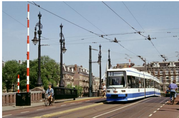
Brug nr 1, Muntplein, autoloze zondag, 18-11-1973 Nwe Amstelbrug, Bremense gasttram, 12-05-1993