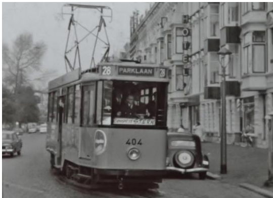
RET, STERN-rit, R'dam Noordereiland, 1967