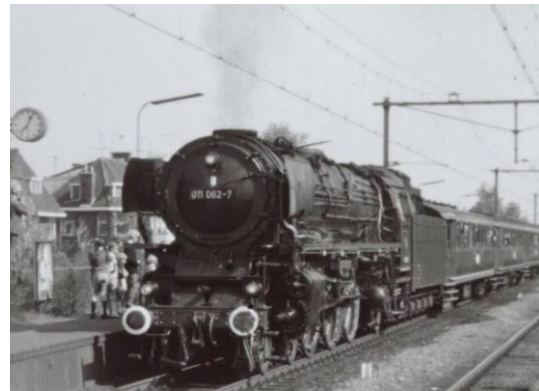
DB 011, NVBS-jubileumexpress, 11-09-1971