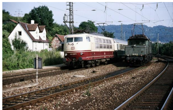
194 121 en 103 228 te Geislingen West, 1978