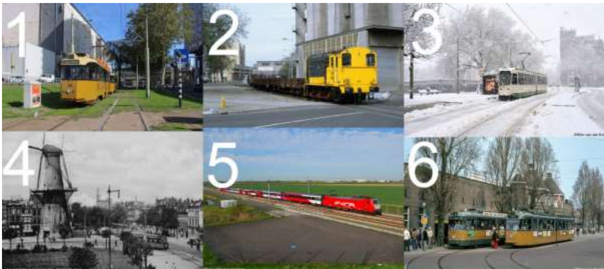
Collage van de Rotterdam-meebrengeavond