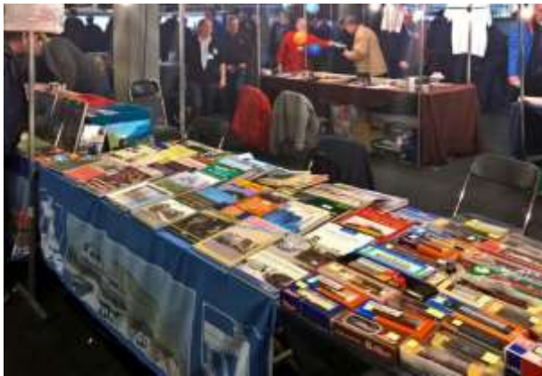
De NVBS stand tijdens de modelspoordagen in Rijswijk.

Buiten Amersfoort was er verkoop op 12 dagen (2 meer dan vorig jaar). Op de Nederlandse Modelspoordagen in Rijswijk, Rail 2019 in Houten en "Terug naar toen" bij de VSM was de winkel samen met L&C aanwezig. We hadden tevens een kraam op de Boekenmarkt in Deventer, op Modelspoor Tilburg en bij het Rail&Road Event te Blerick.