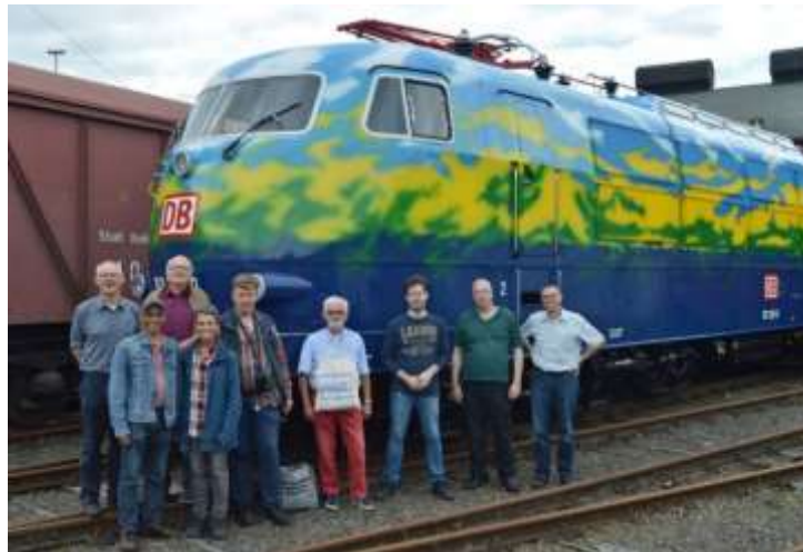
Het gezelschap voor e-lok 103 220 bij het Südwestfälisches Eisenbahnmuseum in Siegen

De bestaande locatie in wijkcentrum 't Sant in Tilburg is uit oogpunt van bereikbaarheid en kosten prima. Wel is er het besef dat leden vanuit West-Brabant wat verder moeten reizen. Mocht iemand in Breda een gelijkwaardige locatie aanbieden met dezelfde lage zaalhuur en bereikbaarheid, en gratis parkeren, dan gaan we daar zeker iets mee doen.