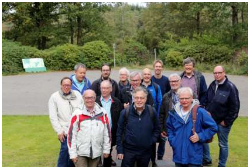
De redactie van Op de Rails in 2019

Ook in 2020 hopen we weer iedere maand een blad met interessante informatie over spoor en tram te produceren.