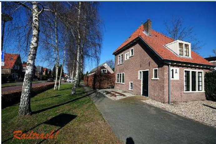
Wachterswoning bij de Asselsestraat in Apeldoorn