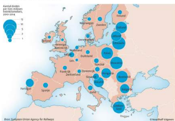
Doden op Europese spoor