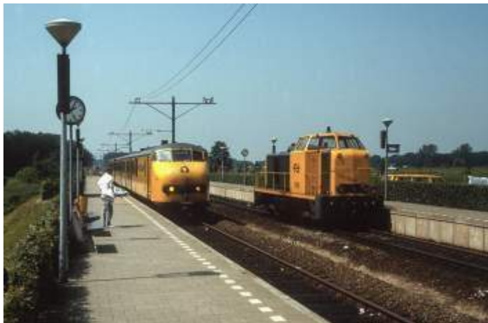
Dalfsen, tijdens de elektrificatie in 1985

Zijn wens was om verbinding te krijgen met Harlingen. Maar dit werd Delfzijl. Maar dit hele project bleek uitermate taai. Uiteindelijk werd in 1898 de wet voor de NOLS door het parlement geaccordeerd. In 1901 ving de bouw aan. Nadat in 1903 de lijn van Zwolle tot Ommen in gebruik werd genomen volgde in 1905 de lijn naar Stadskanaal en de tak van Gasselternijveen naar Assen. In 1906 volgde Mariënberg - Almelo. In 1910 Stadskanaal - Zuidbroek - Delfzijl en de verbindingslijn van station Coevorden op de lijn van de BE (D).