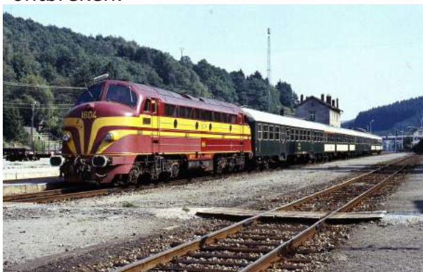
CFL 1604 te Troisvierges in 1989

Na enkele opnamen van de internationale treinen die vroeger via de Oude Lijn reden, bereiken we als eerste Brussel, waar al snel duidelijk wordt dat een bezoek aan onze zuiderburen in de jaren 70 en 80 beslist de moeite waard is. Het elektrificatieprogramma is nog niet geheel voltooid en veel reizigerstreinen rijden nog met, voor Nederlandse begrippen, zware diesellocs. De Athus-Meuse lijn is een prachtig werkterrein voor de Bolle Neuzen. Ook dieselstellen en oudere elocs zijn nog volop in dienst, evenals de oude trams in Brussel, Antwerpen, Gent, Verviers en Charleroi, waar ook de laatste restanten (buiten de kustlijn) van het eens zo grote tramnet van de buurtspoorwegen in het grauwe industrieland van Henegouwen te vinden zijn. De grote variatie aan tram- en spoorwegmaterieel in België krijgt een vervolg bij de CFL in Luxemburg. Een klein land maar zeer veelzijdig doordat het een internationaal spoorwegknooppunt is, waar materieel uit vier landen te zien is. Ook hier waren enkele Bolle Neuzen actief, maar het paradepaard was ongetwijfeld de bruine Krokodil. Tijdens de rondreis door de beide landen zullen ook de modernere tractiesoorten niet ontbreken.