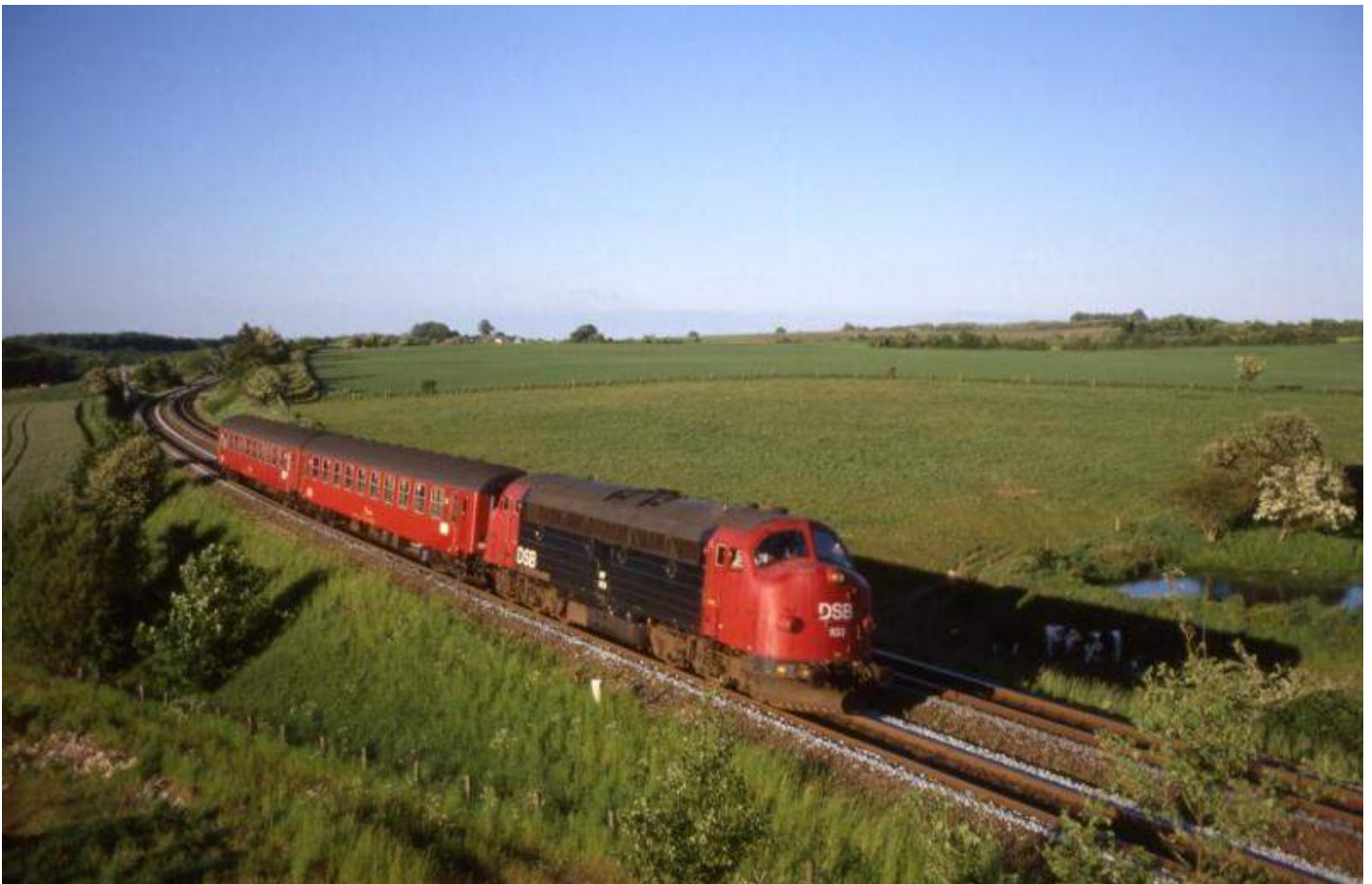
DSB 1133 in Lunderskov (DK).

In het programma maken we een tocht langs verschillende lijnen en bedrijven, waarbij ook de buurlanden Duitsland, Zweden en Noorwegen met een bezoek worden vereerd. Het beeld van de spoorwegen in Denemarken blijkt in 25 jaar duidelijk veranderd, maar het is nog steeds een boeiend vakantieland.