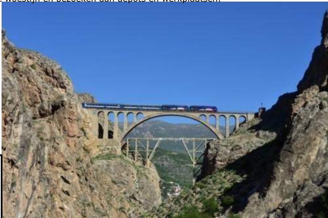
Veresk-brug in de lijn tussen Teheran en de Kaspische Zee met 2 Iranrunners'

Bezoek aan diverse gezondere plaatsen in Teheran, Isfahan en Yazd. Treinen over bergtrajecten met hellingen en keerlussen die we in Europa niet kennen en dus ook lang verborgen zijn gebleven. Treinen door de woestijn en bezoeken aan depots en werkplaatsen.