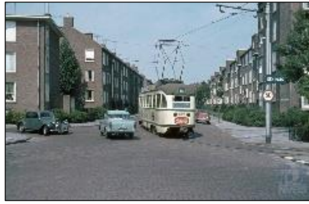
En zo de Stuwstraat in, richting Scheveningen ....