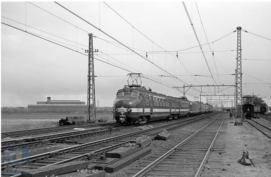
NS 1208 + Pec + EID2 348 + EID4 737 Asd-Vs te Haarlem t.h.v. de Hoofdwerkplaats.

Al meer dan zeventig jaar is er een directe verbinding met doorgaande elektrische treinen van Amsterdam naar Brussel. De presentatie begint bij de voorbereidingen voor en na de Tweede Wereldoorlog, gaat verder over de opening van de Beneluxverbinding in 1957 met de Hondekoptreinstellen, de groei in de jaren 60, de komst van de eerste trekduwtreinen in de jaren 70, het nieuwe materieel in de jaren 80, de Fyra-verbinding en het