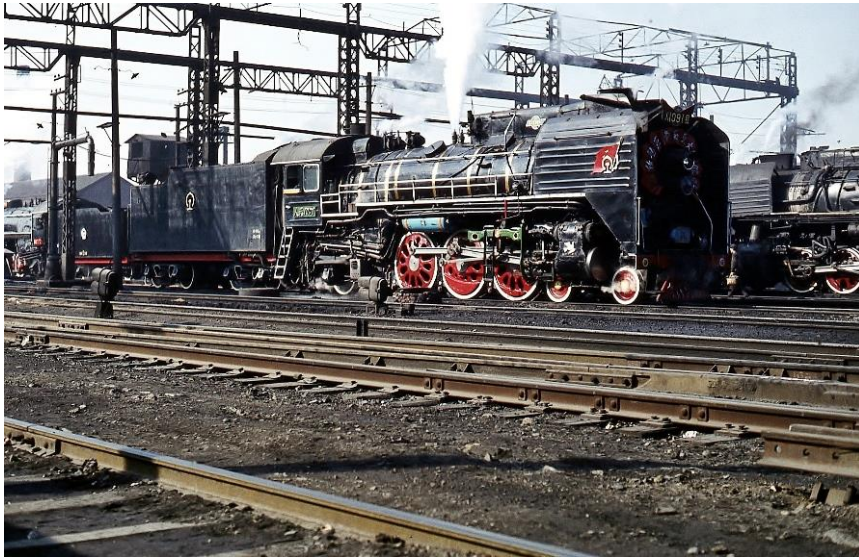
RM 1091 depot Changchun.

Dit soort reizen waren in die tijd altijd een mix van cultuur en hobby. Gelukkig wel, want een bezoek aan de verboden stad en de Chinese muur mag je niet missen, evenmin als het terracottaleger in Xi'an waar de spoorwegen een voor velen nog grotere verrassing hadden, want hier was nog een behoorlijk aantal 2-C-1 Pacifics in de reizigersdienst aan hun laatste dienstjaren bezig. Een hoogtepunt was ongetwijfeld een bezoek aan de laatste grote stoomlokmfabriek ter wereld in Datong waar tot 1987 jaarlijks nog 300 nieuwe lokken gebouwd werden.