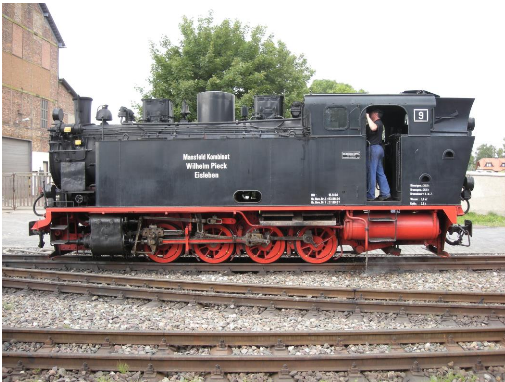
Lok 9, O&K 1931 werd in 2014 verkocht aan de Kinderspoorweg in Jekaterinenburg. Foto P. Doove, Benndorf 2-8-2008

De Domstad Halberstadt ligt iets ten noorden van het eindpunt Quedlinburg. Het heeft slechts 40.000 inwoners en beschikt toch over een trambedrijf dat met twee lijnen de stad doorkruist. In het weekend rijdt lijn 2 door naar het bos bij Klus.