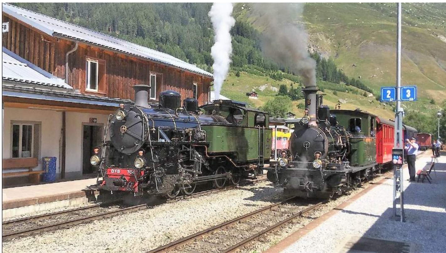
Foto: Station Realp: rechts loc 6, de Weisshorn en links de nieuwste aanwinst van DFB loc 4/4 704, deze heeft op 3 augustus 2018 de eerste rit op eigen stoomkracht gemaakt!

In oktober 1981 reed de laatste trein van de Furka-Oberalp-Bahn over het Furka bergtraject in Zwitserland. Een groep enthousiastelingen, verzameld in de Verein Furka Bergstrecke, wilde dit traject echter van de ondergang redden met het doel deze als museumspoorlijn opnieuw in dienst te stellen. Het plan leek bijna onhaalbaar, maar lukte! Uiteindelijk werd in augustus 2010 het laatste deel van de lijn tussen Gletsch en Oberwald onder grote belangstelling in dienst genomen. De oorspronkelijke stoomlocs werden in Vietnam terug gevonden en rijden nu al weer jaren de goed bezette treinen over het magnifieke bergtraject.