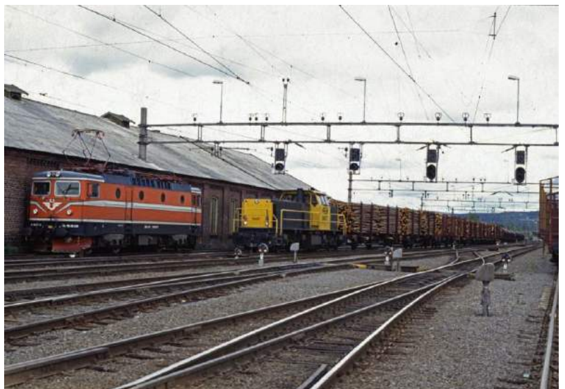
Foto: Door de NSB gehuurde NS 6437 in het Noorse station Kongsvinger op 6-6-1994, Steven Hopman.

We beperken ons ditmaal tot West-Europa, al zal er ook een enkel uitstapje naar (Zuid)Oost-Europa worden gemaakt. Vanavond kijken we naar bekend materieel, echter in een wat minder bekende omgeving.