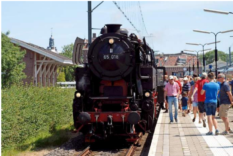
Foto: loc 65 018 van de SSN in Enkhuizen bij het 50-jarig festival van de SHM.

In deze 49 e editie zijn nieuwsfeiten bij spoor- en trambedrijven in binnen- en buitenland te zien uit de periode 1-12-2017 t/m 31-12-2018. De bewegende beelden met synchroon geluid en live commentaar over zaken als railjubilea, nieuw materieel, nieuwe/gewijzigde/opgeheven lijnen en andere actualiteiten, komen weer in chronologische volgorde in beeld. Het wordt ongetwijfeld weer een afwisselend programma, met voor elke rail-liefhebber wel iets interessants om te bekijken.