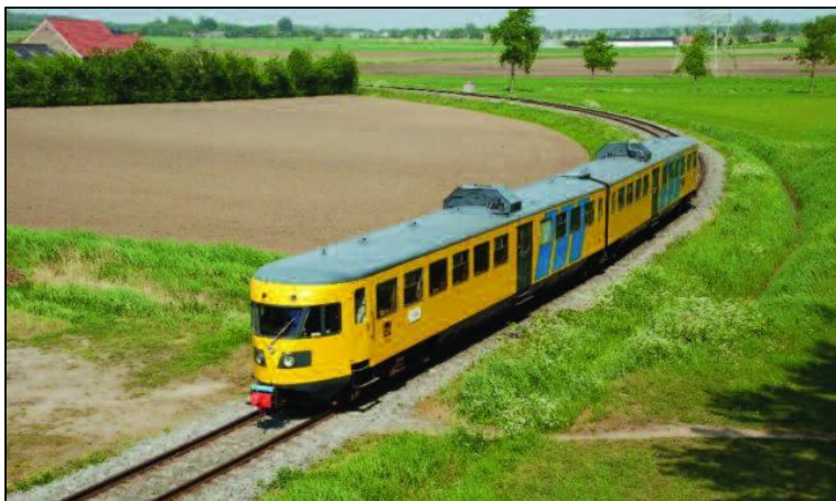
Koninginnedagrit 2011 met DE2