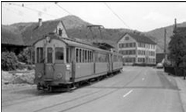
De interlokale tram Schaffhausen - Schleithelm werd in 1964 door bussen vervangen.

Zwitserland is een land van spoor- en tramlijnen bij uitstek. Naast een uitgebreid netwerk van normaal- en smalspoorlijnen kent en kende het land een keur aan lokale en interlokale tramlijnen. Vooral in de wereld van de interlokale tramlijnen is in de laatste decennia veel veranderd. Nogal wat tramlijnen zijn opgeheven, maar een aantal lijnen is hieraan ontsnapt en flink gemoderniseerd. De ontstaansgeschiedenis als tramlijn is vaak nog te herkennen, maar in een aantal gevallen zijn de lijnen uitgegroeid tot een waar spoorwegbedrijf. Het gevolg daarvan is dat de grens tussen spoor en tram in Zwitserland niet altijd makkelijk te trekken is. Ook het gebruik van het materieel kent in de loop van de jaren zijn wisselingen, waardoor het karakter van een bedrijf meer een spoor- dan een trambedrijf is geworden, of andersom. Over dit grijze gebied van tramlijnen in Zwitserland zijn vele presentatie-avonden te vullen. Daarom zal een (willekeurige) selectie van bestaande en intussen opgeheven interlokale trambedrijven van Noordoost- tot Zuidwest-Zwitserland het witte doek passeren, met plaatjes in zwart-wit en kleur uit de jaren 60 tot en met de toestand in de 21ste eeuw. De (inter)lokale tramlijnen van de grote steden bewaren we voor een andere keer.