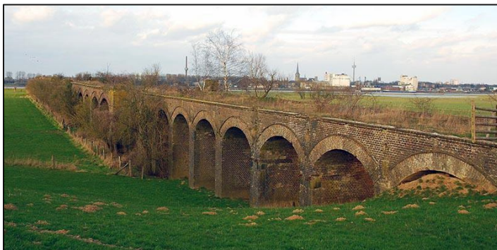
De oude Rijnbrug bij Wesel is gedeeltelijk terugveroverd door de natuur.

Een opgeheven spoorlijn kan al jaren geleden opgebroken zijn, maar nooit verdwijnt hij helemaal uit het landschap. Onder dat motto belichten de presentatoren, auteurs van de Atlas van de Verdwenen Spoorlijnen en makers van de website Railtrash , een aantal bekende en minder bekende binnen- en buitenlandse voormalige spoorlijnen. Wat is hiervan in het landschap nog terug te vinden? Met actuele beelden en historisch fotomateriaal nemen zij ons mee op een speurtocht door dit deel van de spoorweghistorie. Aan bod komen Nederlandse lokaalspoorwegen en lijnen van internationale allure, zoals de NBDS-lijn. Verder laten Michiel en Victor hun licht schijnen over enkele spectaculaire en militair-strategische, maar niettemin verdwenen spoorlijnen in Duitsland en Frankrijk en vertellen ze over hun onderzoeksmethoden.