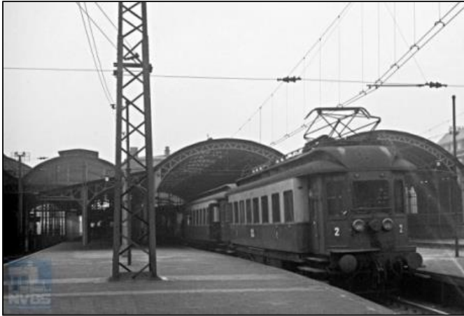
Den Haag HS, 1931, Foto: collectie SNR.