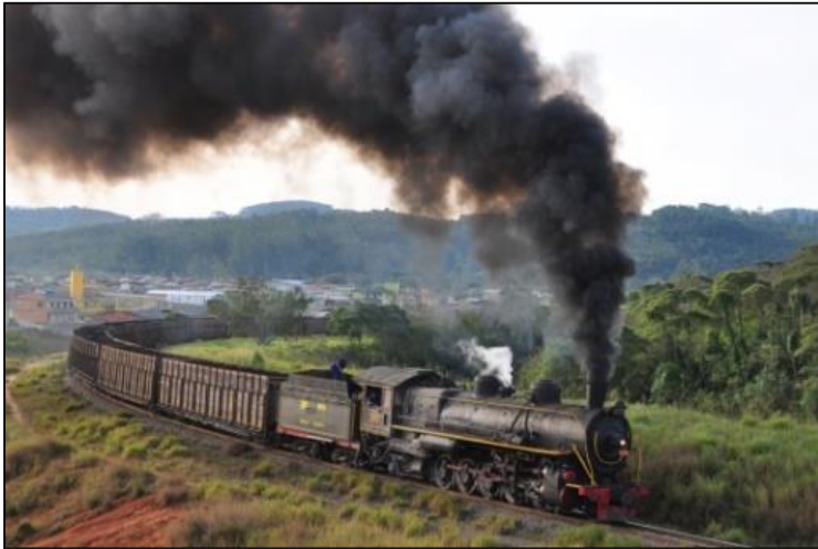
Smalspoor kolenstoom in Brazilië bij de Donna Teresa Cristina.