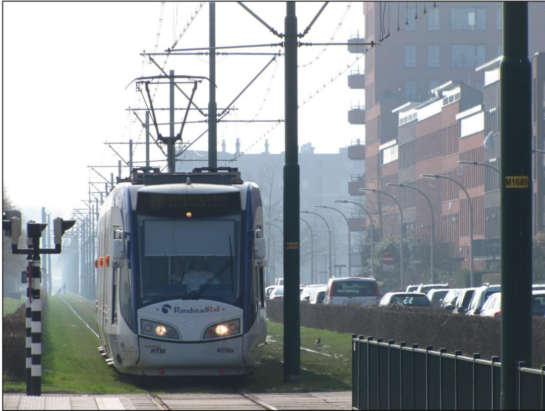
HTM lijn 19, een Haagse tramlijn die nauwelijks in Den Haag komt! Ypenburg, 16 maart 2017