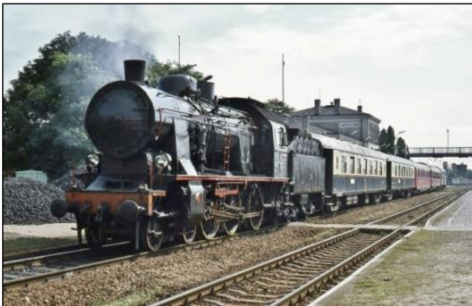
Loc Ok22.77 met Pullmanrijtuigen te Choszczno, 7 sept. 1977

Met 120 à 130 km/h zorgden de BR 01 en 03 in de DDR voor een belevenis en ervaring van de glansrijke sneltreinjaren van weleer. Wederom via Tsjechoslowakije, waar de 'blauwe papegaai' een hoofdrol speelde, werd Oostenrijk weer bereikt, waar de 55 deelnemers konden terugkijken op een geslaagde en zeer bijzondere reis, waarbij ook enkele smalspoorlijnen werden bereden en waarvoor in totaal 36 verschillende locomotieven, waaronder 25 stoomlocs, in actie kwamen!