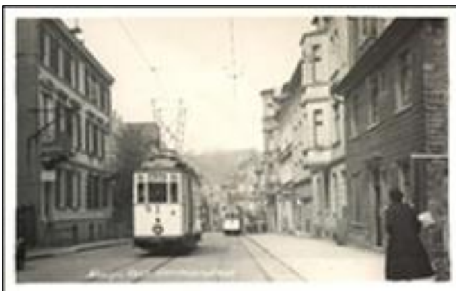
Wuppertal, Neviges, ca. 1950

Kort na afloop van de Tweede Wereldoorlog keerde de tram terug in het verwoeste Duitsland. Terwijl de steden nog in puin lagen, tingelden de trams alweer door de straten. In een fascinerend hoog tempo herstelde de in 1949 opgerichte Duitse Bondsrepubliek zich van de oorlogsschade. Gelijktijdig met de toenemende welvaart verdween de tram uit de kleinere steden. In dezelfde periode vervingen busdiensten de elektrische streektrams op de interlokale verbindingen. In de Jaren van het Wirtschaftswunder reizen we aan de hand van zwart-witbeelden van Flensburg in het noorden naar Freiburg en Lörrach aan de Zwitserse grens. We bezoeken bekende maar ook bijna vergeten trambedrijven. Herstelde oude tweeassers, op dat moment nieuwe KSW- en Aufbau-trams, maar ook de eerste moderne Grossraum- en gelede wagens zorgen voor een aangename variatie in het tramlandschap.